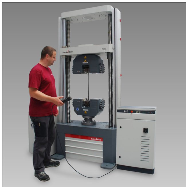
Z400RED mit Hydraulik-Probenhalter